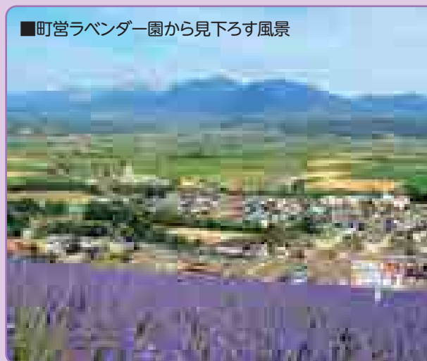
■町営ラベンダー園から見下ろす風景