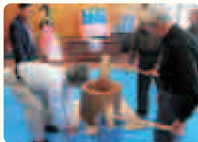
昨年の「みさぽーとまつり」の様子

住民活動センター「みさぽーと」では、町民の皆さんの市民活動やボランティア活動のお手伝いをしています。