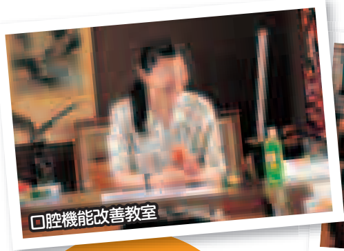
口腔機能改善教室

千畑地区では口の体操を用いた「口腔機能改善教室」、六郷地区では音楽を用いた「認知症予防教室」、仙南地区では呼吸法やストレッチを用いた「転倒予防教室」がそれぞれ開催され、387名が参加。参加者同士でやり方を教え合うなど、リラックスした雰囲気の中で楽しく健康づくりに取り組みました。