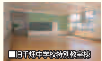
■旧千畑中学校特別教室棟