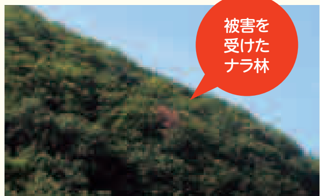
※赤くなっている部分が被害を受けたナラ林

広葉樹(ナラ林)がカシノナガキクイムシ(成虫)によって次々と枯死していく「樹木の伝染病」です。被害が拡大すると森林景観が大きく損なわれたり、きのこ栽培、家具材などに利用される木材資源が減少します。さらに、森林の水源涵養や土砂災害の防止等の機能が低下します。