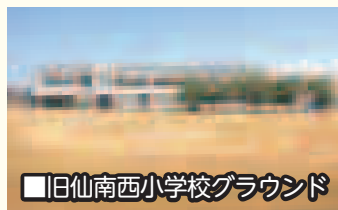
■旧仙南西小学校グラウンド