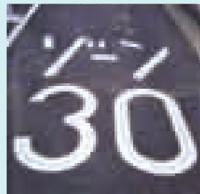
▲路線ではなくゾーン(区域)で規制 ◀「ゾーン30」の標識・標示