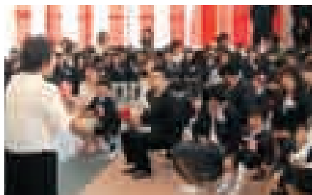
仙南幼稚園・保育園(すこやか園)