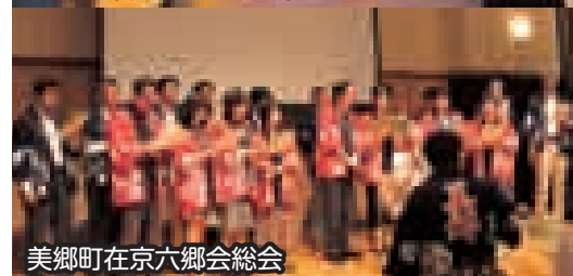
美郷町在京六郷会総会