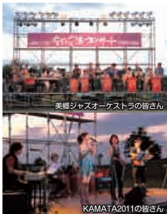
美郷ジャズオーケストラの皆さん