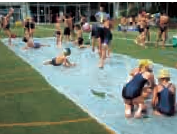
▲人工芝の校庭で水遊び(御田小学校)