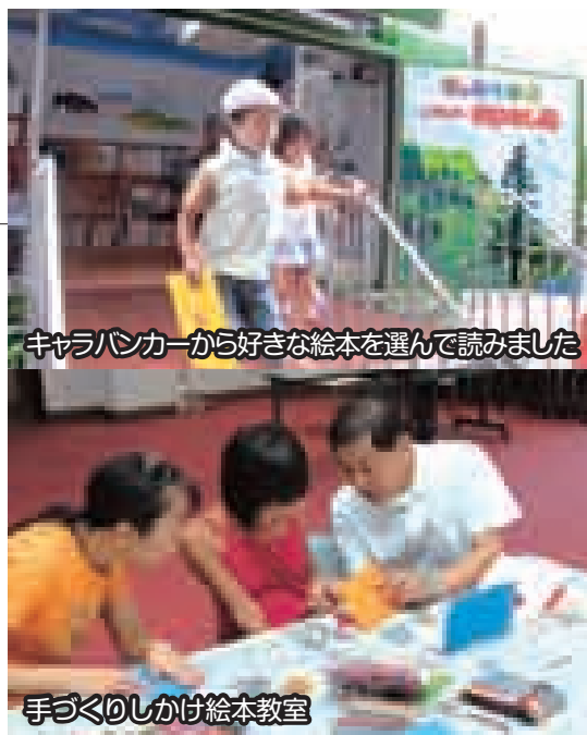
キャラバンカーから好きな絵本を選んで読みました

また、7月31日には千畑交流センターと中央ふれあい館で「手づくりしかけ絵本教室」が開かれ、親子連れなど合わせて28名が参加しました。この教室は、しかけ絵本づくりを通じて本の楽しさや物を作る喜びを知ってほしいと町が主催したもので、参加した皆さんは講師から「しかけ絵本」の基本的な仕組みを教わり、それぞれのアイデアを盛り込みながら自分だけの絵本を作っていました。