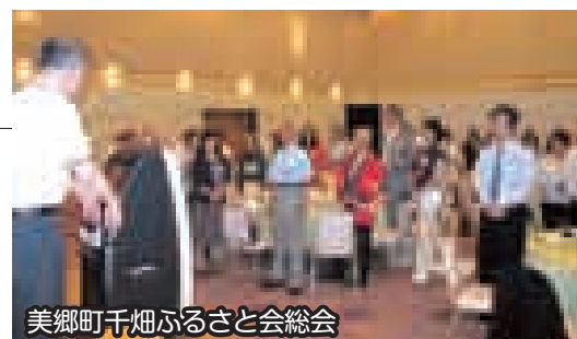
美郷町千畑ふるさと会総会

総会では関東圏の3つの会の統合に向けた協議や準備作業を開始することについて、両会の会員の皆さんから賛同をいただきました。既に賛同いただいている仙南ふる里会も含め、今後、統合に向けた話し合いを進めていきます。 問●町商工観光交流課 交流・商工班 ☎0187(84)4909