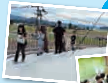
▲配水タンクの屋上に上がったよ

児童たちからは「水はどこから来るの?」「どうやってきれいにするの?」「1日にどれくらい使っているの?」「水はなくなるの?」など、たくさんの質問をいただきました。水は「天からの恵み」であること、安全な飲み水として各家庭まで届けられるようさまざまな施設があること、少しの水を使っても水道料金として家族が払ってくれていることを説明すると、児童たちは「これからは水を大切に使います」と口を揃えて言ってくれました。