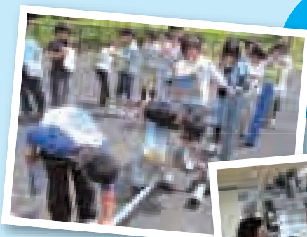
▲道路の下に埋められている水道管を触ったよ