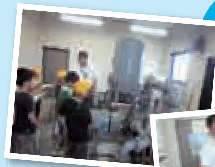
▲こんなに近くで浄水機器を見学しました