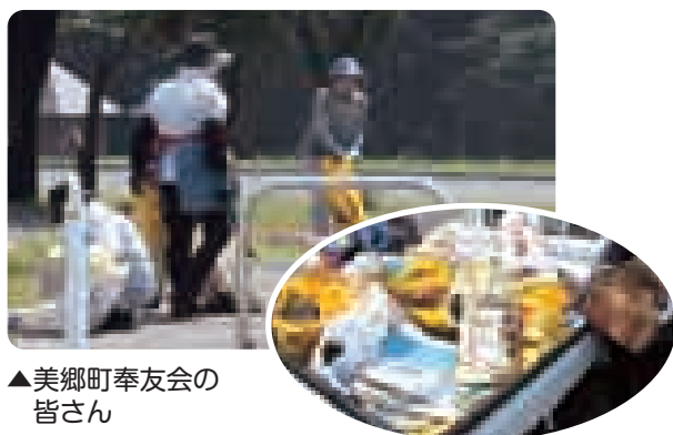
▲美郷町奉友会の皆さん