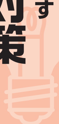
■電力供給力と想定電力需要

東日本大震災の影響により電力供給バランスの悪化が見込まれています。また、これから夏を迎え電力供給状況がさらに厳しくなると予想されます。引き続き最大限の節電に取り組み、国が示した各家庭での15%節電を達成できるように、ご理解とご協力をお願いします。