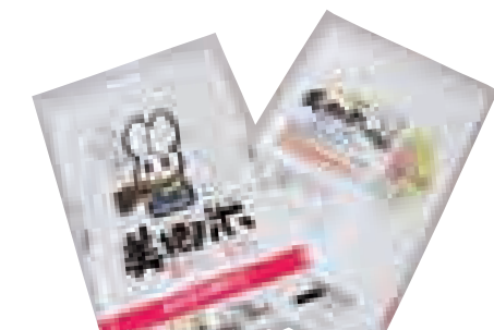
「美郷米」の米袋ができました。お米の形の耳がチャームポイントのマイミーちゃんが「美郷米」の目印です。