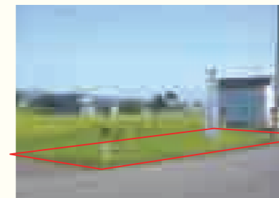
【物件番号1】佐野字土場41番1、176番1