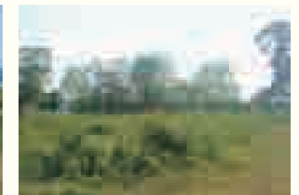
【物件番号3】六郷字南明天地179番