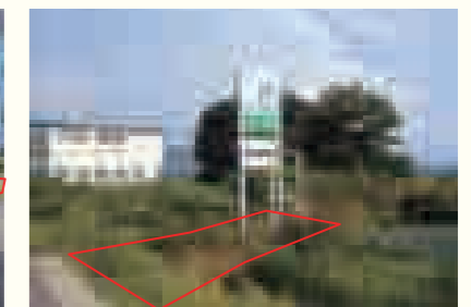
【物件番号6】六郷字赤城90番12