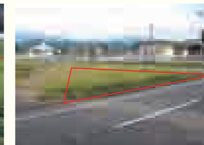
【物件番号8】土崎字上野乙170番1