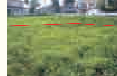
【物件番号7】小荒川字街道筋165番1、164番1、163番1、158番1(4筆)