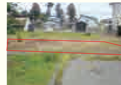
【物件番号4】六郷字小安門59番4