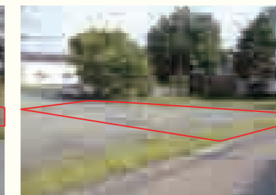
【物件番号5】六郷字古館南29番7