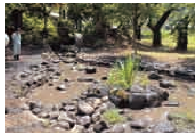
▲落ち葉や泥が取り除かれ、きれいになったドリームトープ