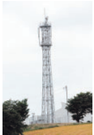
▲完成したFOMA携帯電話用アンテナ

町では引き続き、携帯電話不感地帯解消に向け、町内における携帯電話用電波の調査および各携帯電話会社へのアンテナ等建設要望活動を行っていきます。町民の皆様のお住まいの地区で携帯電話が繋がりにくい地域がありましたら、役場下記担当までご連絡ください。