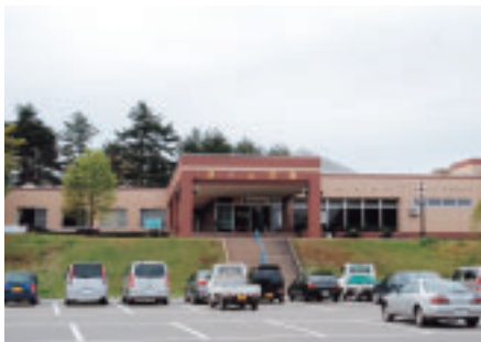
湯とぴあ雁の里温泉

今後、報告書を踏まえながら経営改善などを行い、住民の皆さまにより親しまれる温泉施設となるよう取り組んでまいりますので、ご理解ならびにご利用をお願いいたします。