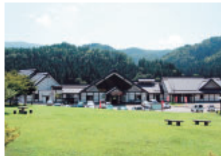
六郷温泉あったか山