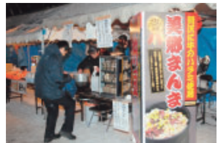
▲竹うちに訪れた人たちに「美郷の味」をPR