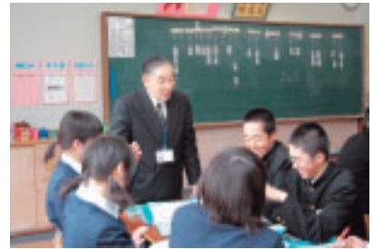
六郷中学校を訪問し、生徒との交流を図る教育アドバイザー。