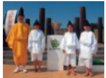
8月15日、千屋小学校の子どもたちと国体炬火採火式に参加した松田町長(写真左)