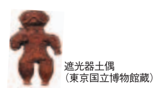
遮光器土偶 (東京国立博物館蔵)