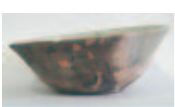
鳥の絵が描かれた墨書土器 (美郷町郷土資料館蔵)