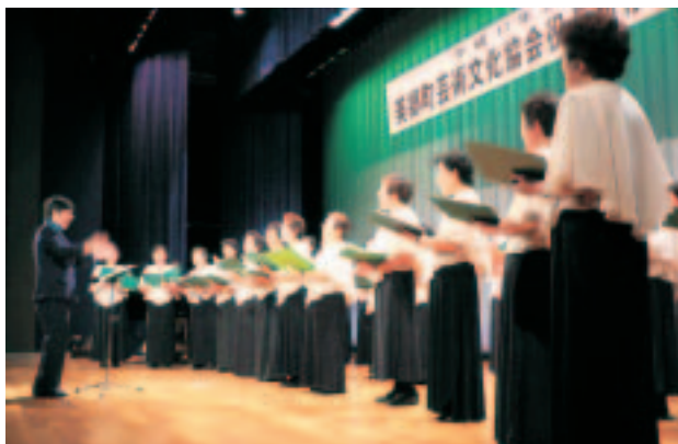
発表会で熱唱する せせらぎコーラス の皆さん

平成六年の六月に発足し、十一年目になりました。昨年の三月には、手作りの十周年コンサートを催すことができました。