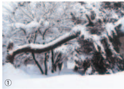
図1 積雪量の変化 (平成17年12月27日～平成18年1月27日)