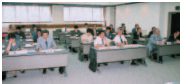
▲初総会後に開かれた協議会の様子