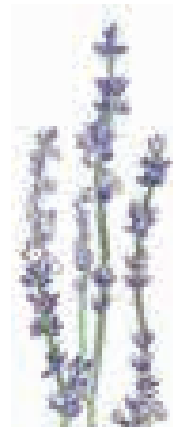
町の花・ラベンダー

「乱れ」の逸話は広い世代に知られており、歴史的にも本町にふさわしいものです。 魚は「ハリザッコ」。本町の清水等に多く見受けられ、美しい郷にふさわしいイメージがあります。正式な呼び名はイバラトミヨですが、地域ではハリザッコとして親しまれています。 なお、当日会場の大型スクリーンでも紹介された町の木・花・鳥・魚のイラスト(右)は、絵ががきとして町内全世帯に配布されています。 また、採用作品に応募していただいた方の中から抽選で五十人に、町から記念品が贈られています。