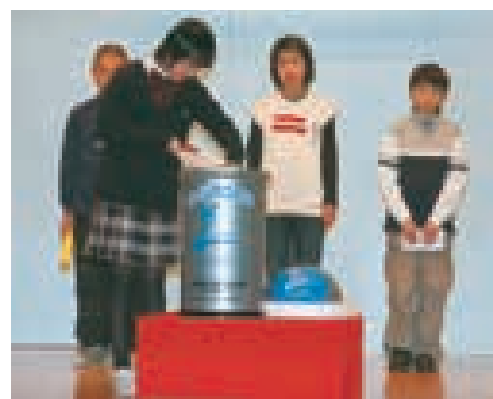
思い出の詰まった品々を▶ タイムカプセルに投入

また、美郷町のシンボルとなる町の木・花・鳥・魚がお披露目されました。 町の木は「赤松」。本町全域に広く見受けられ、特に千屋の松並木は新日本街路樹百景に選定されるなど、他の市町村に誇れるシンボルです。 花は「ラベンダー」。本町には一・五ヘクタールにも及ぶラベンダー園があり、開花期間中には五万人を超える観光客が訪れます。壮大で美しく甘い香りは本町のイメージにあさわしいものです。 鳥は「雁(かり)」。本町は「後三年の役」合戦の古戦場でもあり、「雁行の