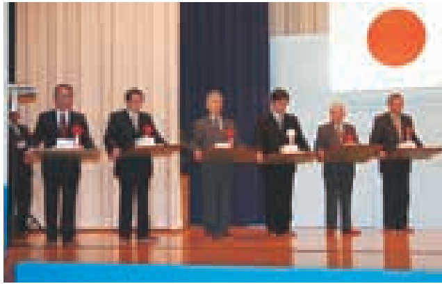
▲合併功労者として総務大臣表彰を受けた旧3町村の首長と議会議長

その後、合併の実現に献身的に尽力したとして旧三町村の首長と議長六人が総務大臣表彰を受けるとともに、元合併協議会委員や元新町将来構想建設計画審議会委員、元特別職報酬等審議会委員合わせて五十四人に、美郷町長から感謝状が贈られました。