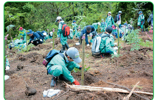
小学生による植樹の様子

また植樹に先立って学習会を行い、水の大切さや森林のはたらきについて学びきっかけとなっています。