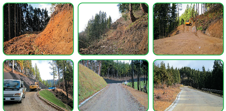
林道「七滝山線」工事の様子