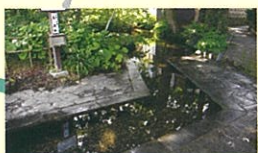
名水百選 六郷湧水群