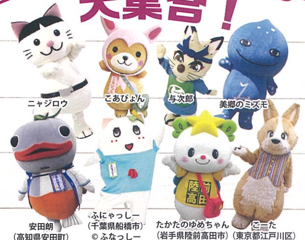
ニャジロウ こあひよん 与次郎 美郷のミズモ 安田朗 (高知県安田町) ふにゃっしー (千葉県船橋市) ◎ふなっしー たかたのゆめちゃん (岩手県陸前高田市) こた (東京都江戸川区)